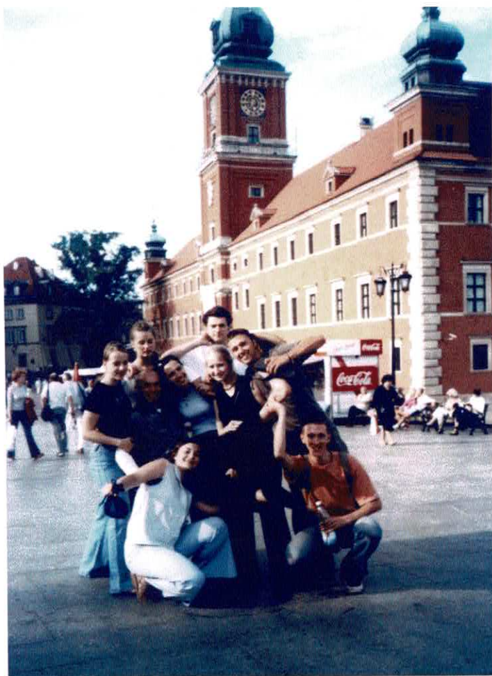
XII Międzynarodowa Letnia Akademia Muzyki Dawnej Warszawa 5. - 13. lipca 2003 Podczas spaceru, przed Zamkiem Królewskim