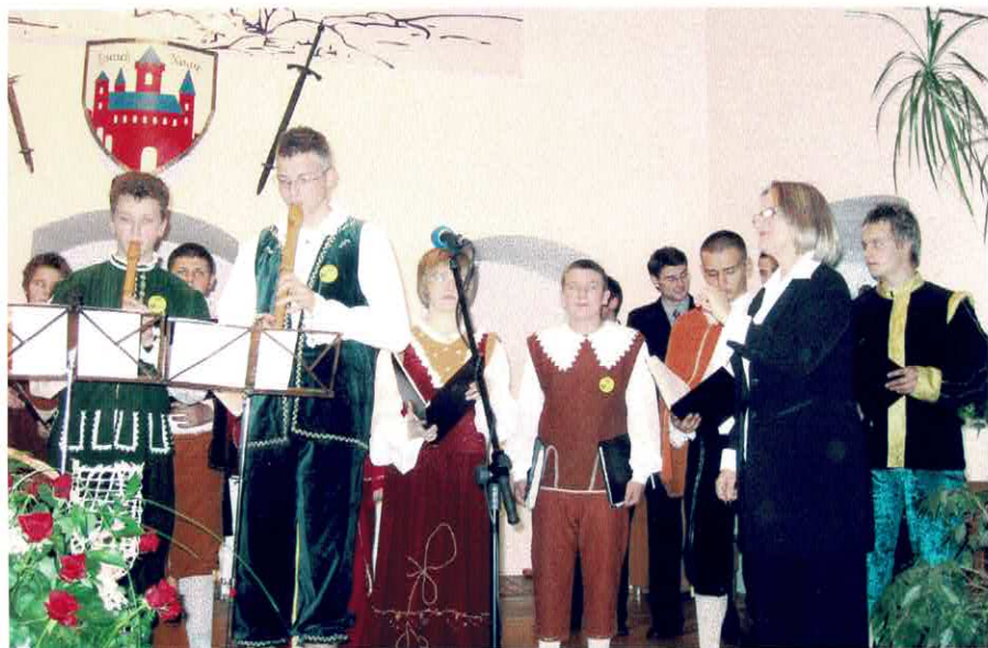
Jubileuszowy koncert 25-lecia na Zamku Wspólny z Zespołem Mille Regretz