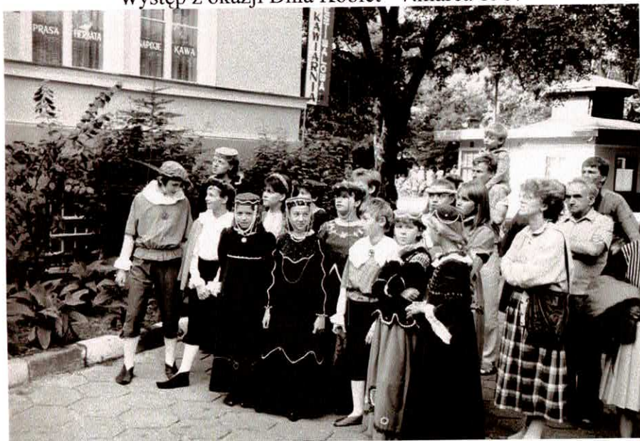
W Międzyzdrojach – 16. sierpnia 1987