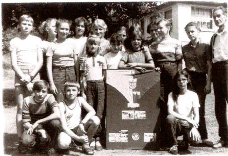
W górach Herzu w m. Ilfeld – sierpień 1985