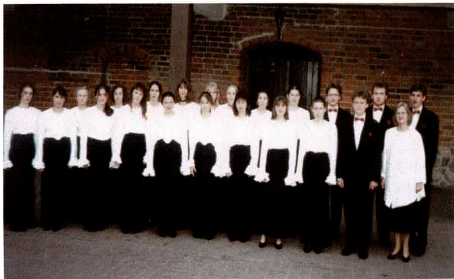
Uczestnicy Schola Cantorum – Kalisz '94 po powrocie, przed Zamkiem