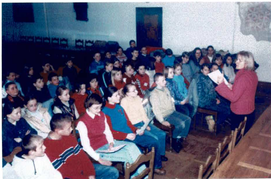
Nabór kandydatów do Zespołu cieszył się dużym zainteresowaniem