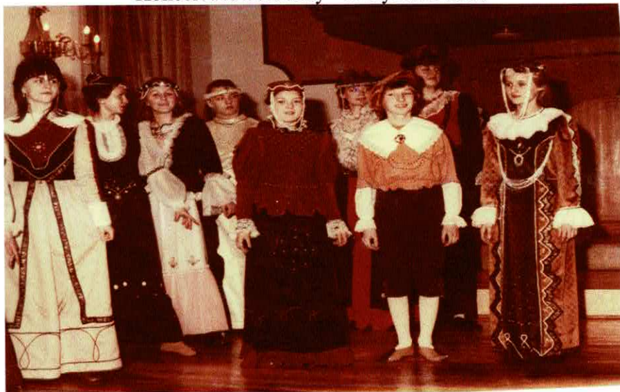
Schola Cantorum – Kalisz – 2. luty 1988