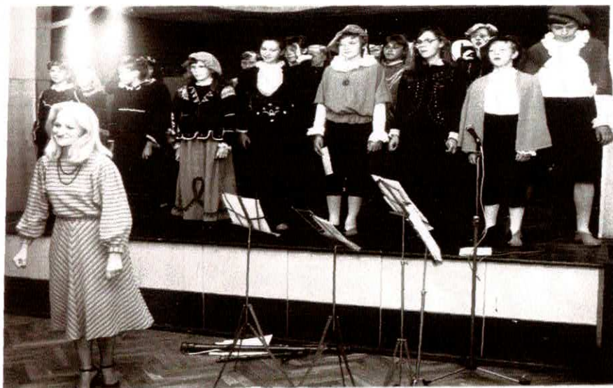
W świetlicy Pomorskich Fabryk Mebli – wrzesień -1986