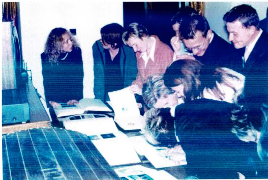
Przeglądnie kronik – to była dopiero frajda