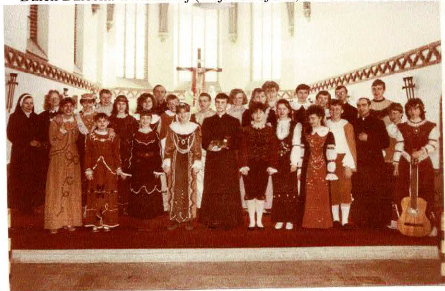
Wielkanoc w kościele św. Maksymiliana – 27. marca 1989