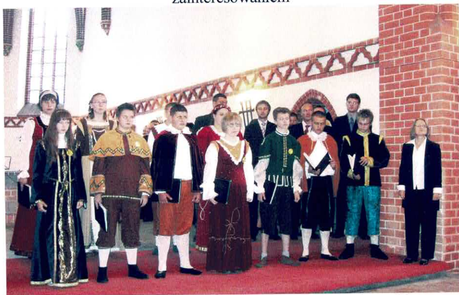
Jubileuszowy koncert 25-lecia w kościele św. Maksymiliana