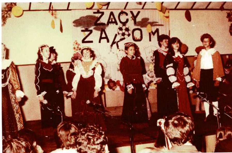
Dzień Dziecka w Łukowej (woj. zamojskie) 2 – 4 czerwca 1988