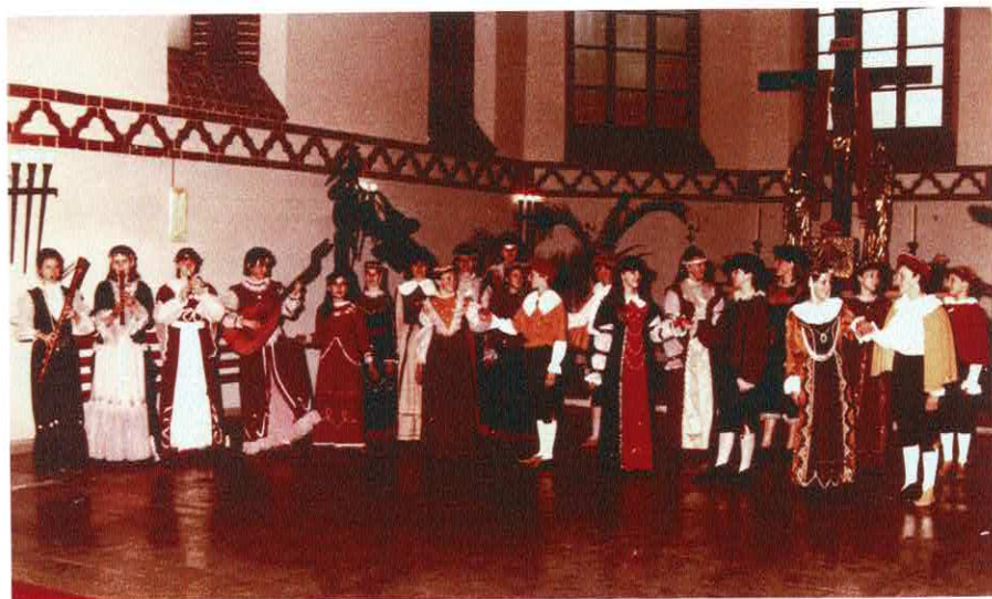
Koncert w kościele św. Maksymiliana