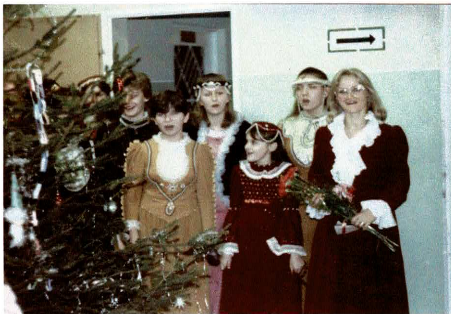
Koncert Noworoczny - 2. stycznia 1988