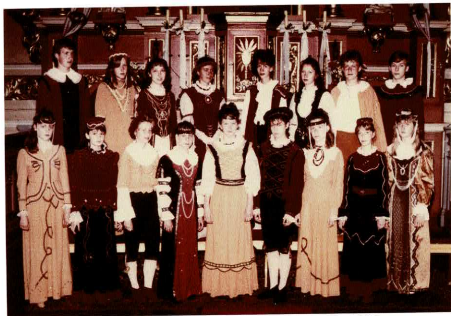
W kościele św. Mateusza – 10. czerwca 1990