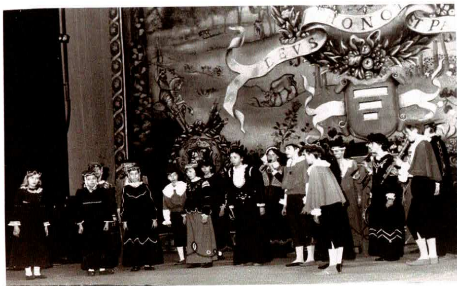
W Teatrze Polskim w Bydgoszczy Występ z okazji Dnia Kobiet - 7.marca 1987