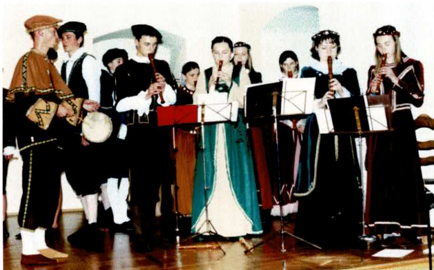
Koncert jubileuszowy 20-lecia - 2003