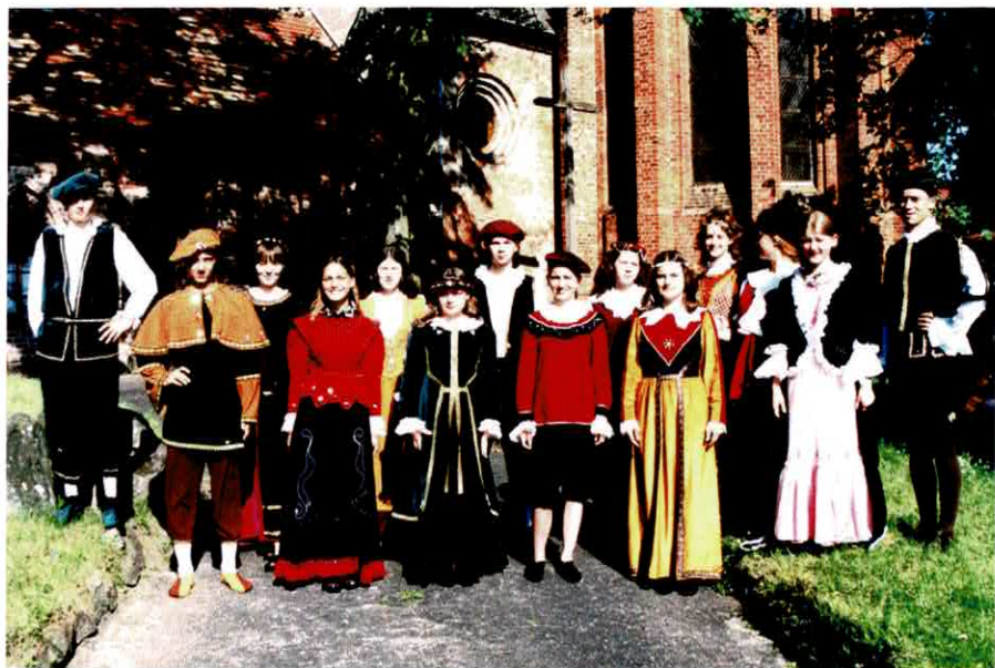
V Ogólnopolskie Warsztaty Muzyki Dawnej „Bierzwnik” 1. - 10. lipca 1999