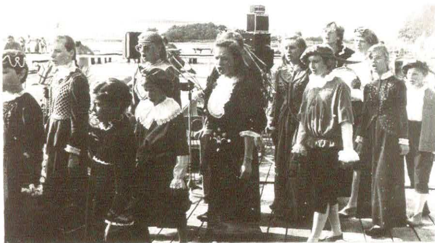
Wenecja k/Żnina – lipiec 1986