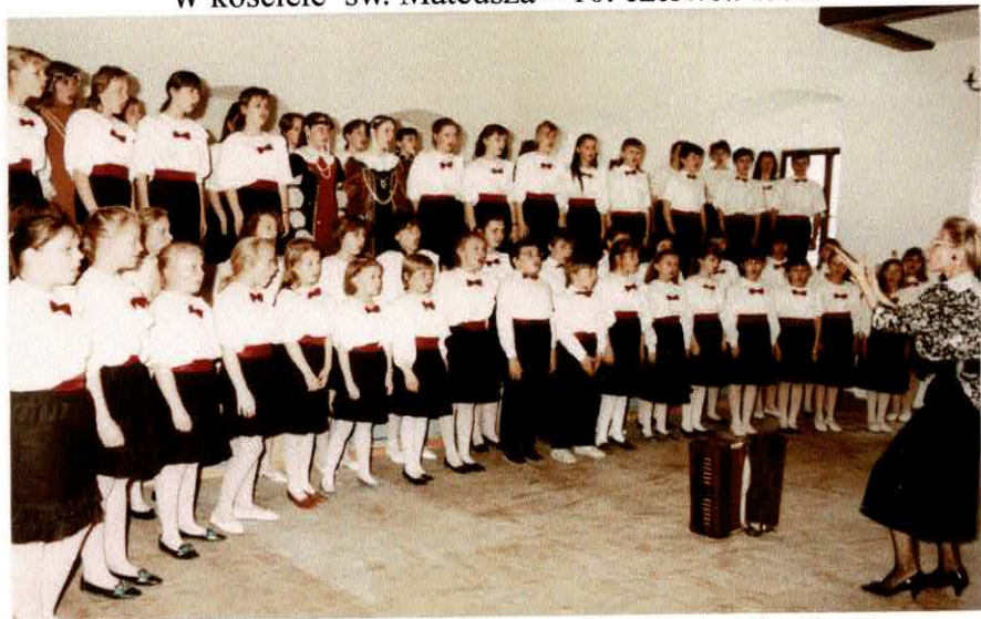
Zespół i chór szkolny koncertowali dla gości z Danii z m. SAKSKØBING – kwiecień 1991