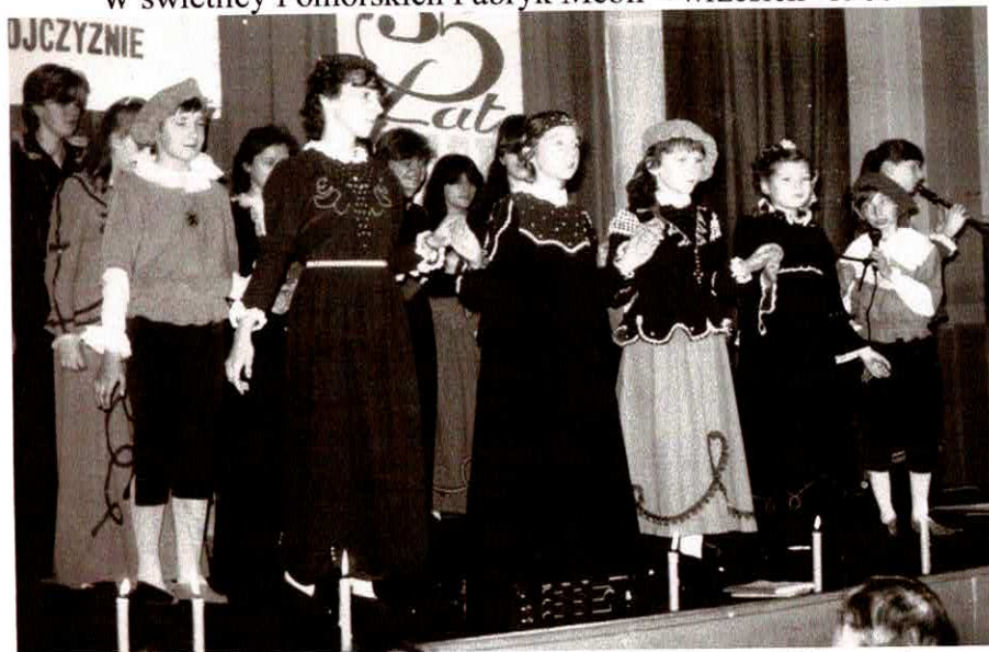
Występy dla załogi Elektronicznej Spółdzielni Inwalidów podczas uroczystości 35-lecia działalności – 17. listopada 1986